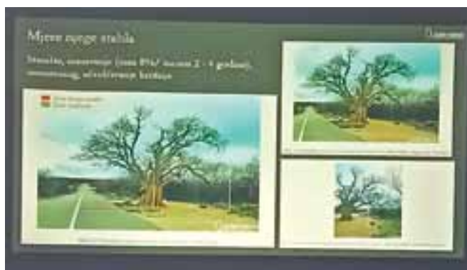
Prezentacija, Kontrola starog stabla koprivića – specijalistički elaborat, 5. veljače, 2025. u Vrbniku