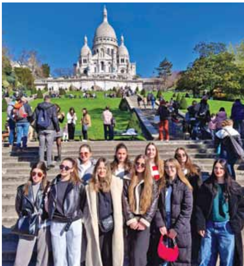
Mobilnost učenika u svrhu učenja, 22. - 29. ožujka. 2025., Montargis, Francuska