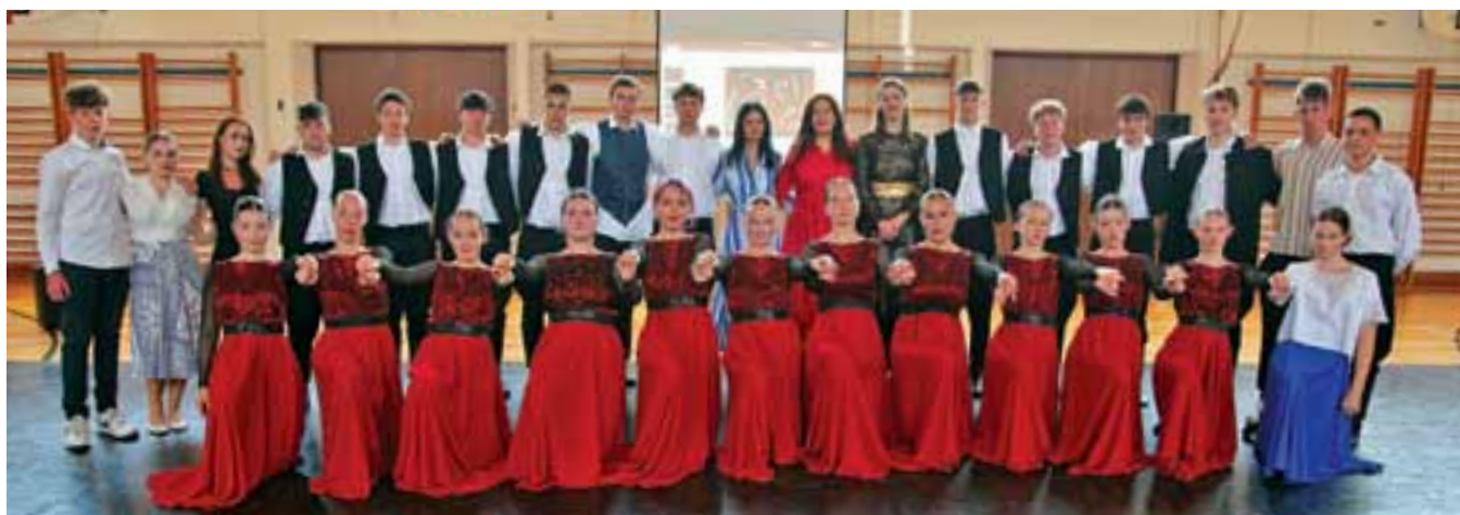
HOŠIGOV „Vremeplov“ je ujedno i put u budućnost: steći i širiti spoznaju kako se na zajedničkim vrijednostima temelji suradnja Hrvatske i Mađarske u zajedničkoj Europi.

U okviru Erasmus akreditacije SŠHKZ je realizirala mobilnosti učenika u sklopu programa Erasmus+. Međunarodni projekti učenicima otvaraju vrata svijeta, osnažuju komunikacijske i socijalne vještine te pridonose razvoju europskog identiteta. Nastavnicima takvi projekti omogućuju uvid u različite obrazovne modele i prakse, a istovremeno promoviraju hrvatsko obrazovanje na europskoj razini.