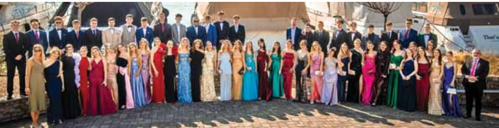
Maturanti, generacija 2024. / 2025.