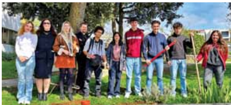
Posjet učenika i nastavnika iz partnerske škole GO Atheneum Geraardsbergen iz Belgije, 24. ožujka 2025.