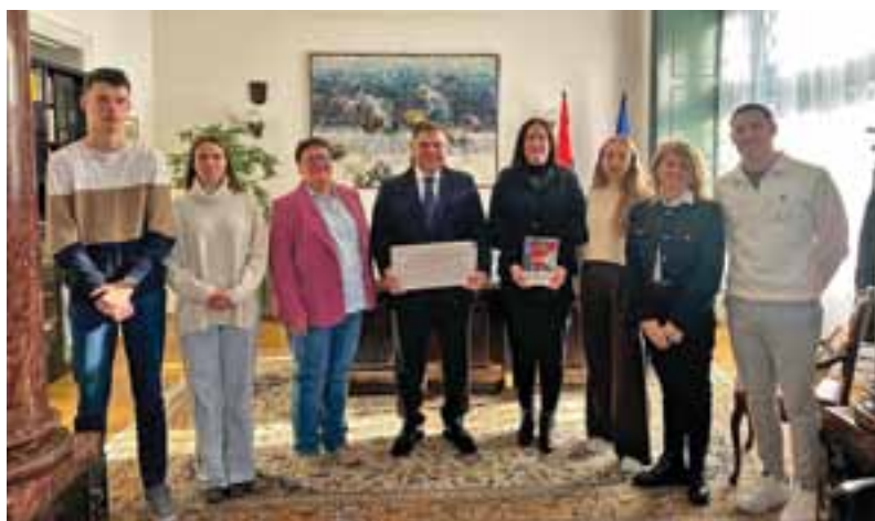
Mobilnost učenika u svrhu učenja, 18. - 22. veljače 2025., Budimpešta, Mađarska