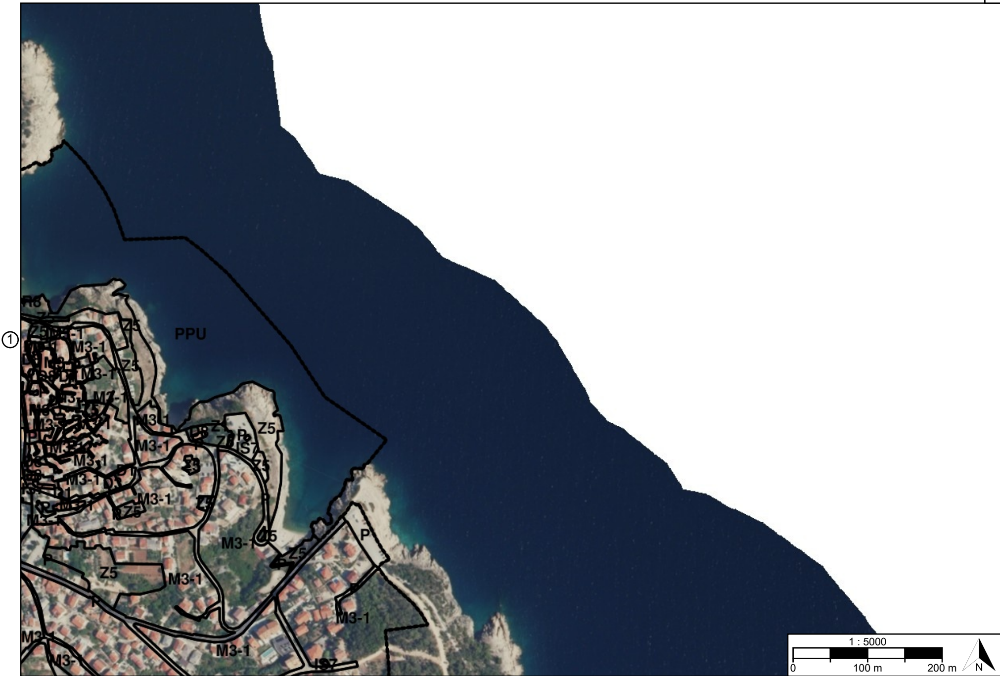
Postupak transformacije Urbanistički plan uređenja UPU 1 Vrbnik - NA 1